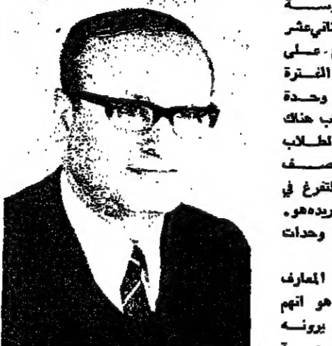
Portrait of a man, likely a politician or official mentioned in the article.

قانون التنظيم والبناء - ١٩٦٥ . وقال المهندس ان قانون التنظيم والبناء هو قانون مهم . وقال ان قانون التنظيم والبناء هو قانون مهم . وقال ان قانون التنظيم والبناء هو قانون مهم .